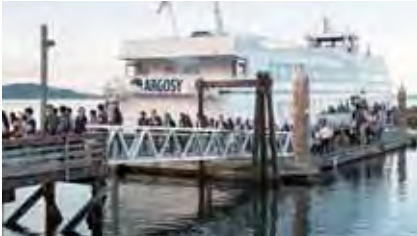
棧橋からトーテムポールの入口をくぐりブレイク島「ティリカム・ヴィレッジ」へ Crossing the jetty through a totem pole entrance to Tillicum Village, on Blake Island.

On Blake Island, in Tillicum Village the welcome continued with a ritual performed by the local tribe and in a longhouse, we were treated to an evening meal with barbecued locally caught salmon as its centerpiece whilst we enjoyed the display put on by the tribes-people.