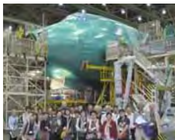
ボーイング工場VIPツアー Boeing factory Tour

It was mainly high school and junior high school students who joined the "Japanese-American History" tour, through which, they were able learn a great deal which they would never have had the chance to learn in a school classroom at home.