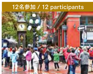
12名参加 / 12 participants