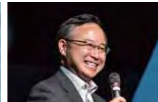
在シアトル日本国総領事 山田洋一郎氏 Yoichiro Yamada, Consul General of Japan in Seattle