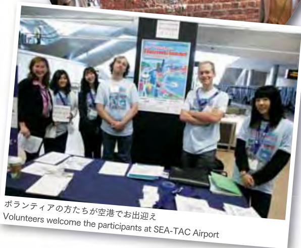
ボランティアの方たちが空港でお出迎え Volunteers welcome the participants at SEA-TAC Airport