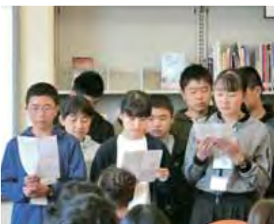
生徒たちによるそれぞれの学校及び地域紹介プレゼンテーション Various presentations from students about the school and the region

As with the Atlanta Summit last year, two junior high schools from Fukushima were here. Katsurao Junior High School sent 9 students and 4 teachers. 15 students and 3 teachers came from Kawauchi Junior High. Tye Middle School, as the host, is a large school, many of the children are from families with parents who work in the numerous IT companies based around Seattle. About half the students who attend the school are Asian Americans. The Fukushima students took classes and had the chance to experience school life different from that of Japan, they felt the warmth of the host families welcome and all-in-all had a full and rounded, exchange experience.