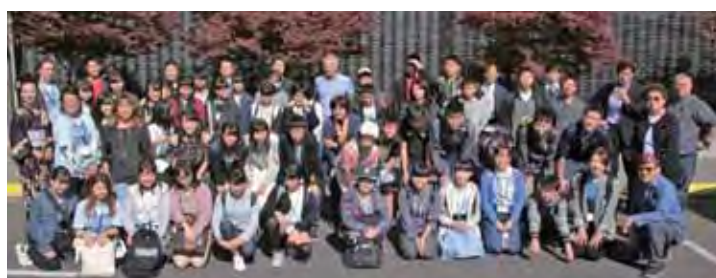
日本人文化コミュニティセンター Japanese American History & International District Tour