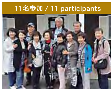
11名参加 / 11 participants