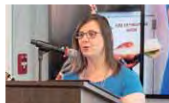
シアトル市助役 シェファリ・ラガナサン氏 Shefali Ranganathan, Deputy mayor of Seattle