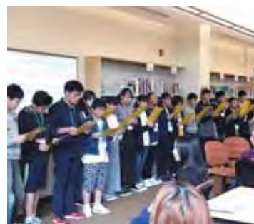
「上を向いて歩こう」合唱 Singing "Sukiyaki" together