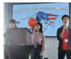
奈良県立畝傍高等学校の 生徒によるプレゼンテーション A Presentation by Students from Unebi High School, Nara