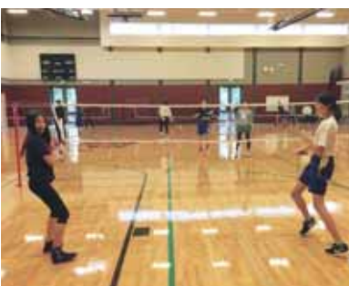
バドミントン交流試合 Exchange badminton matches