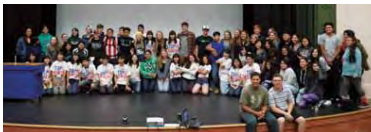
ウェルカム集会 Welcoming Assembly

The town of Mt. Vernon is an hour to the north of Seattle, close to the Canadian border nestled in natural surroundings, with the sea, mountains and forests are all nearby. The visiting students thoroughly enjoyed their time with their high school hosts!