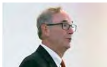
ベルビュー市長 ジョン・チェルミニャック氏 John Chelminiak, Mayor of the City of Bellevue