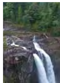
ツインピークスツアー "Twin Peaks" & Winery Tour