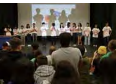
畝傍高校生徒によるプレゼンテーション Presentation by Unebi High students, attendance of classes and participation in club activities