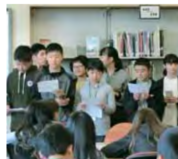
「上を向いて歩こう」合唱 Singing "Sukiyaki" together