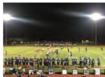
アメリカンフットボール試合観戦 Watching an American Football game