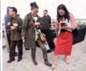
先住民から振舞われる貝のスープ。 食べ終わった貝殻は、その場で地面に落とし砕くのがティリカム・ヴィレッジ流 After finishing the shellfish soup we were given, we trampled the shells on the ground, as is the custom here in Tillicum.