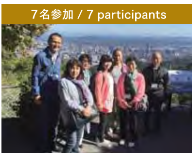
7名参加 / 7 participants