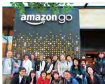
ビジネスツアーで訪れたamazon go Seattle Business Tour