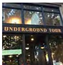
SAFECO ツアー Underground Tour & SAFECO Stadium Tour