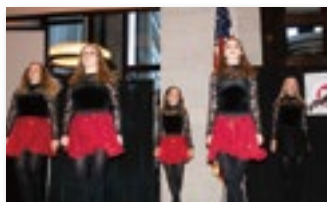
アイリッシュダンスによる歓迎のパフォーマンス Welcoming performance by Irish dancers