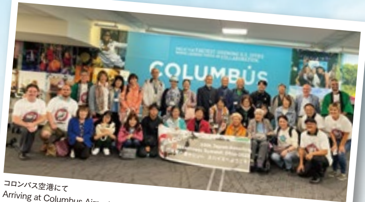
コロンバス空港にて Arriving at Columbus Airport